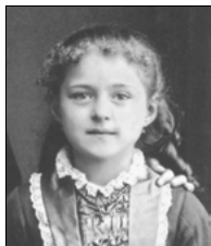
Cierpieć i być wzgardzoną.