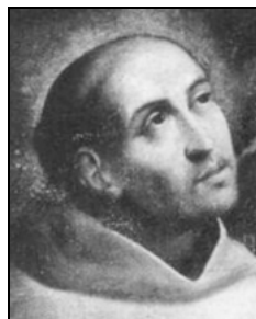
Jest to święty w sposób szczególny od miłości.