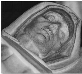
Grobowiec św. Jana od Krzyża, Úbeda (fragment).