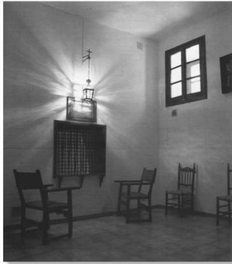
Rozmównica klasztoru karmelitanek bosych w Medina del Campo.

W tym okresie należy zwrócić uwagę na decydujące spotkanie z Teresą od Jezusa (na przełomie września i października 1567, w tym czasie Jan udaje się do Medina, aby tam odprawić swoją pierwszą Mszę św.). Rozmowę, którą wówczas odbyli, Teresa streszcza w kilku wymownych zdaniach: Jan, dwudziestopięcioletni młodzieniec, wyznaje Teresie swoje pragnienie „przejścia do Kartuzów”. Święta wspomina: „prosiłam go bardzo, aby poczekał, gdyż byłoby wielkim dobrem, jeśli pragnie poprawić swoje życie, dążyć do tego pozostając w swoim własnym Zakonie. Jan zasadniczo zgadza się na to, jednakże jednocześnie przynagła: On dał mi słowo, że to uczyni, byleby tylko sprawa zbytnio się nie odwlekała”. Wrażenie, jakie wywarł Jan na Reformatorce, wyraziła ona w następującym prostym stwierdzeniu: „byłam z niego bardzo zadowolona” (F 3,17).